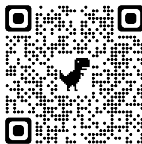
学科/専攻 YouTube チャンネル